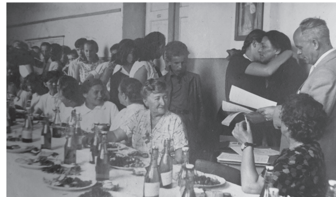
Zdjęcie z roku 1958 lub 1959

Obecnie w szkole zatrudnionych jest 84 nauczycieli i 25 pracowników administracji i obsługi.